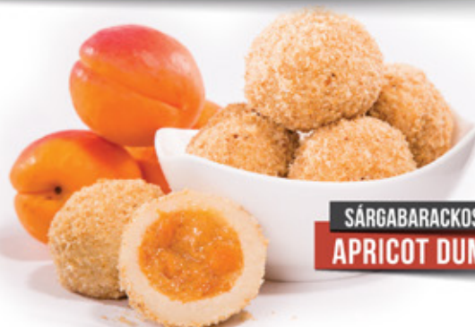
SÁRGABARACKOS GOMBÓC APRICOT DUMPLINGS