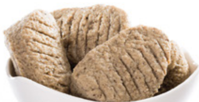
LAKODALMAS MÁJGALUSKA WEDDING LIVER DUMPLINGS