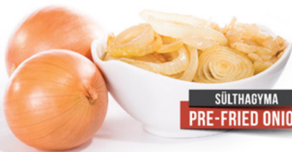
SÜLTHAGYMA PRE-FRIED ONION