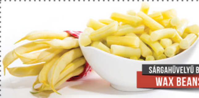
SÁRGAHÜVELYŰ BAB WAX BEANS