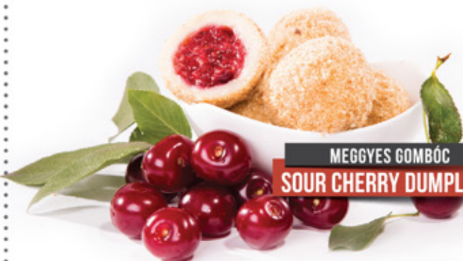
MEGGYES GOMBÓC SOUR CHERRY DUMPLINGS