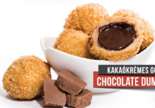
KAKAÓKRÉMES GOMBÓC CHOCOLATE DUMPLINGS