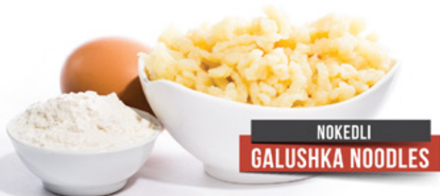
NOKEDLI GALUSHKA NOODLES