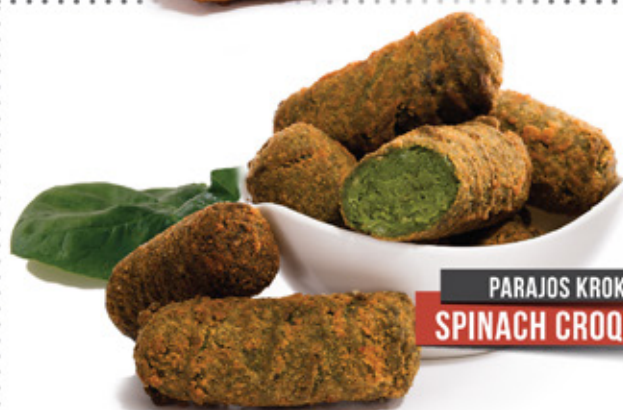
PARAJOS KROKETT SPINACH CROQUETTES