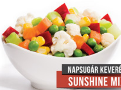
NAPSUGÁR KEVERÉK SUNSHINE MIX