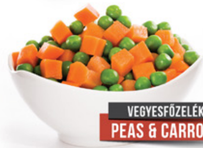
VEGYESFŐZELÉK PEAS & CARROTS