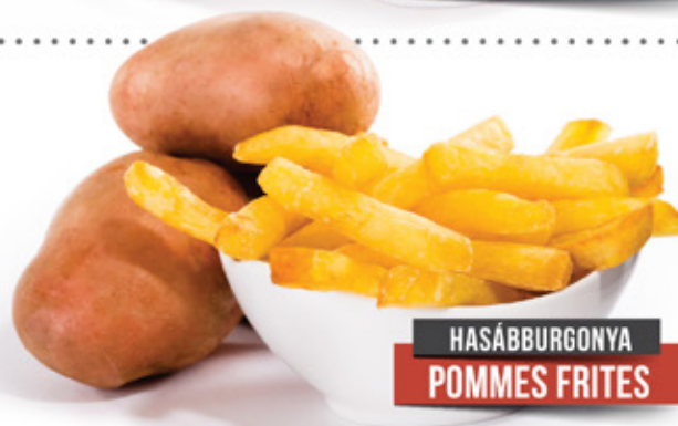
HASÁBBURGONYA POMMES FRITES