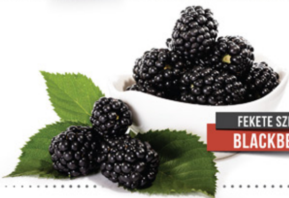
FEKETE SZEDER BLACKBERRY