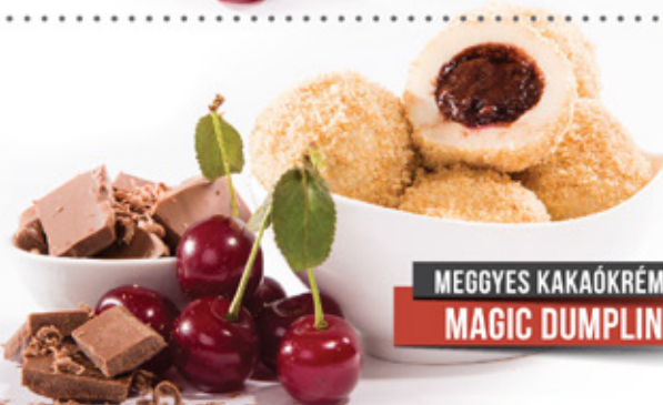
MEGGYES KAKAÓKRÉMES G. MAGIC DUMPLINGS