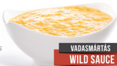
VADASMÁRTÁS WILD SAUCE

Traditional recipe Special technology several kind vegetables