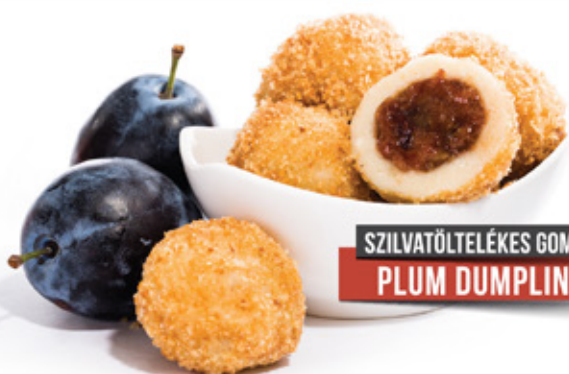
SZILVÁTÖLTÉLÉKES GOMBÓC PLUM DUMPLINGS