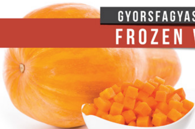
SÜTŐTÖK BUTTERNUT SQUASH