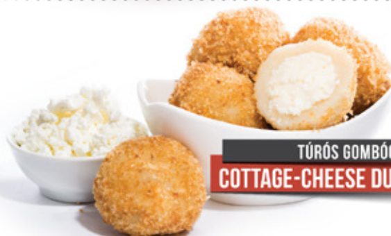
TÚRÓS GOMBÓC COTTAGE-CHEESE DUMPLINGS