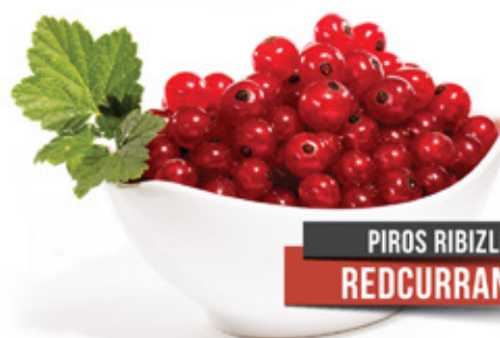
PIROS RIBIZLI REDCURRANT