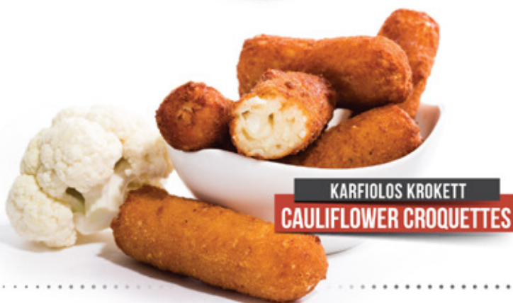
KARFIOLÓS KROKETT CAULIFLOWER CROQUETTES