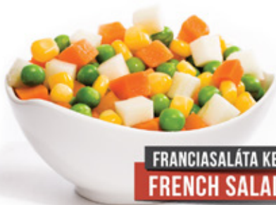
FRANCIASALÁTA KEVERÉK FRENCH SALAD MIX