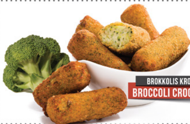
BROKKOLIS KROKETT BROCCOLI CROQUETTES