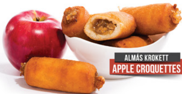
ALMÁS KROKETT APPLE CROQUETTES