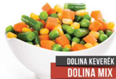
DOLINA KEVERÉK DOLINA MIX