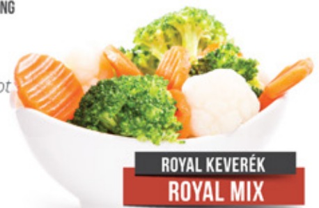
ROYAL KEVERÉK ROYAL MIX