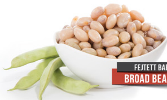
FEJTETT BAB BROAD BEANS