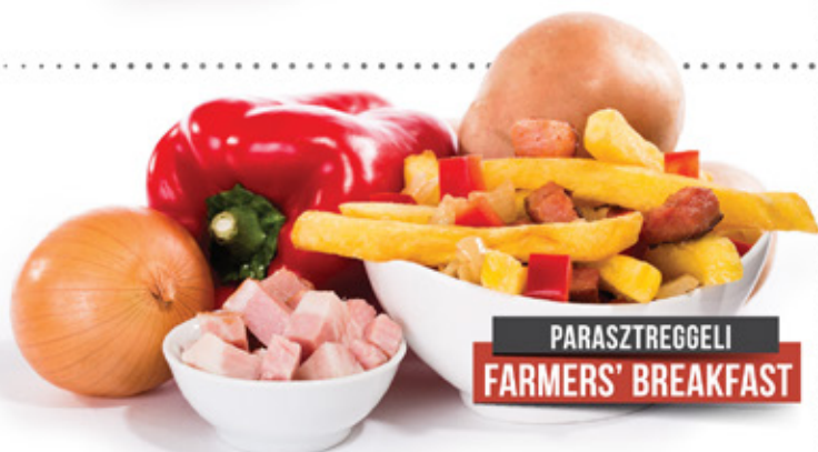
PARASZTREGGELI FARMERS' BREAKFAST