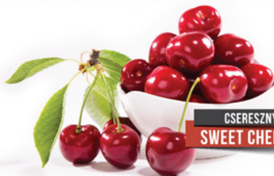
CSERESZNYE SWEET CHERRY