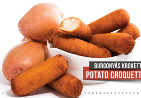
BURGONYÁS KROKETT POTATO CROQUETTES