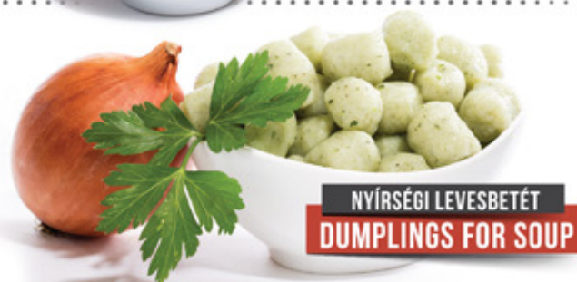
NYÍRSÉGI LEVESBETÉT DUMPLINGS FOR SOUP