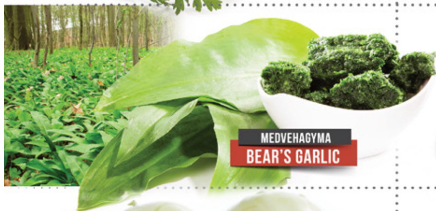
MEDVEHAGYMA BEAR'S GARLIC