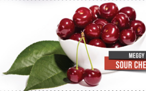
MEGGY SOUR CHERRY