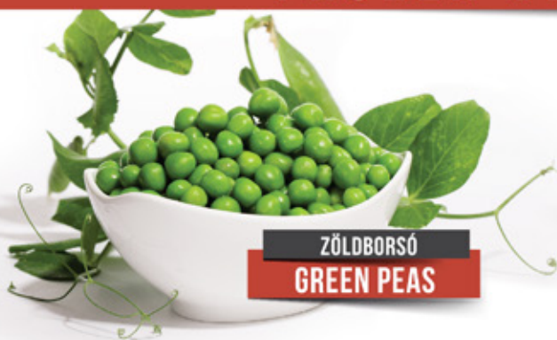
ZÖLDBORSÓ GREEN PEAS