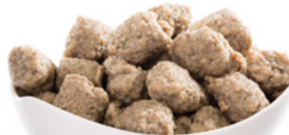
MÁJGOMBÓC LIVER DUMPLINGS