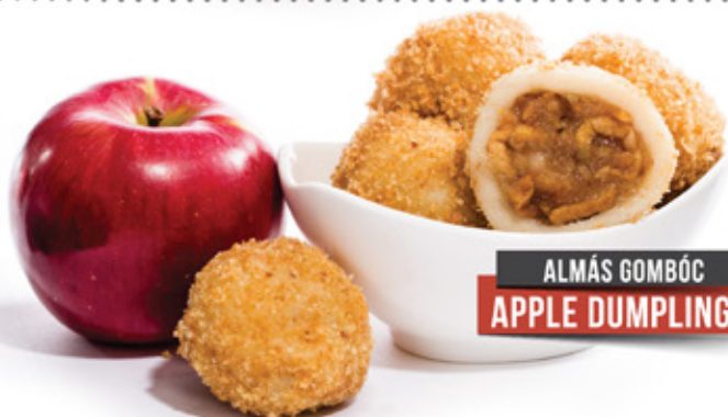
ALMÁS GOMBÓC APPLE DUMPLINGS