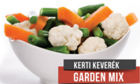
KERTI KEVERÉK GARDEN MIX