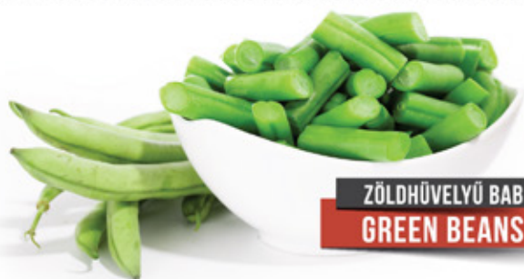
ZÖLDHÜVELYŰ BAB GREEN BEANS