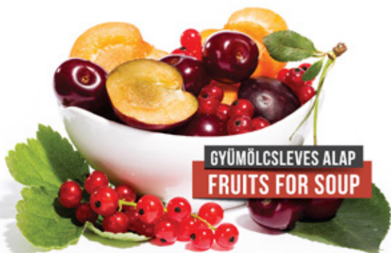
GYÜMÖLCSLEVES ALAP FRUITS FOR SOUP