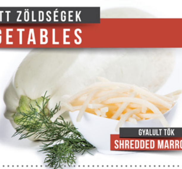
GYALULT TÖK SHREDDED MARROW