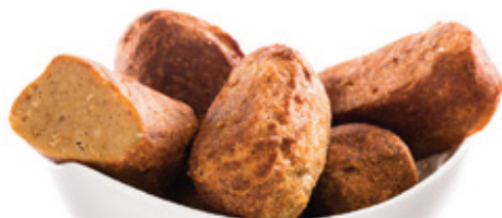
HÚSPOGÁCSA MEAT BALLS