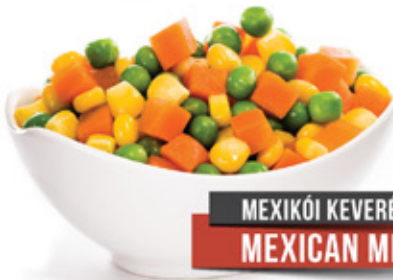
MEXIKÓI KEVERÉK MEXICAN MIX