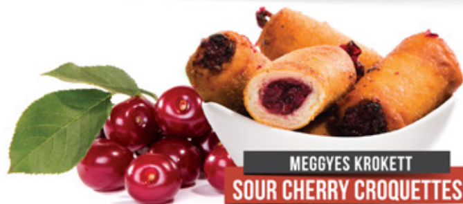
MEGGYES KROKETT SOUR CHERRY CROQUETTES