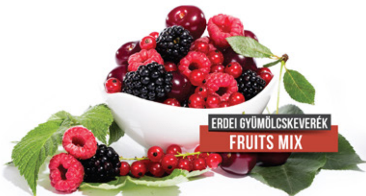
ERDEI GYÜMÖLCSKEVERÉK FRUITS MIX