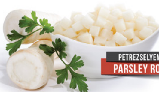
PETREZSELYEM PARSLEY ROOT