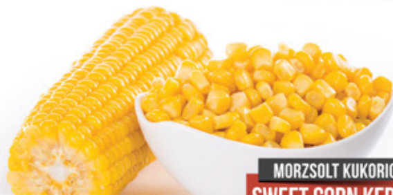
CSÖVES KUKORICA CORN ON COBS