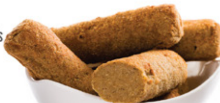
BÉLSZÍNROLÓ SIRLOIN ROLLS

HAGYOMÁNYOS RECEPT SPECIÁLIS TECHNOLÓGIA 7 FÉLE ZÖLDSÉG