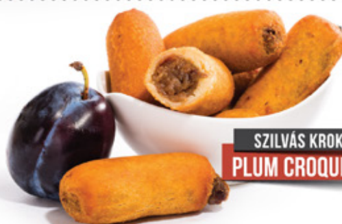
SZILVÁS KROKETT PLUM CROQUETTES