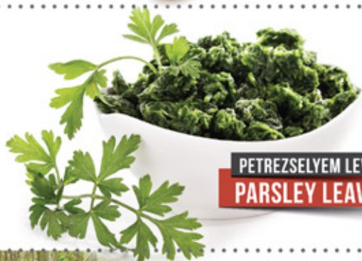
PETREZSELYEM LEVÉL PARSLEY LEAVES