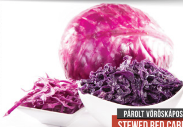
PÁROLT VÖRÖSKÁPOSZTA STEWED RED CABBAGE